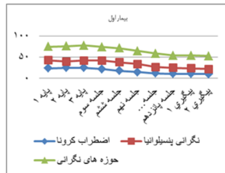
شکل ۱. روند تغییر نمرات بیماران در طی مراحل خط پایه، مداخله و پیگیری

شکل ۱، روند کاهش نمرات بیماران در مقیاس اضطراب کرونا، پرسشنامه نگرانی پنسیلوانیا و پرسشنامه ابعاد نگرانی را به تفکیک نشان می‌دهد.