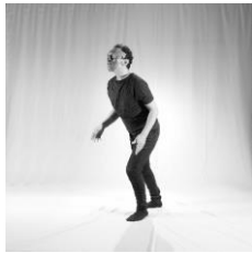
تصویر ۷. حیرت زده (حیرت)