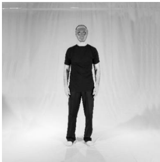
تصویر ۱. خنثی (آماده)

جهت سنجش معناداری تصاویر منتخب به دست آمده، از دو گروه آزمایش و کنترل که تعداد هر کدام ۵۰ نفر (۲۵ مرد و ۲۵ زن) از افرادی که در مراحل قبلی شرکت نکرده بودند آزمایش به عمل آمد. در گروه آزمایش شش تصویر منتخب از شش هیجان پایه نشان داده شد. همچنین در گروه کنترل شش تصویر خنثی که هیچ کدام از هیجانات پایه را نمایش نمی‌دادند، به افراد تحت بررسی نشان داده شد.