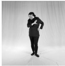
تصویر ۶. متنفر (نفرت)