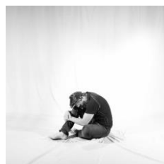
تصویر ۳. غمگین (غم)