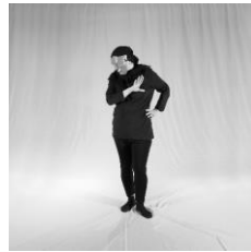
تصویر ۶. متنفر (نفرت)