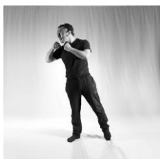
تصویر ۴. خشمگین (خشم)