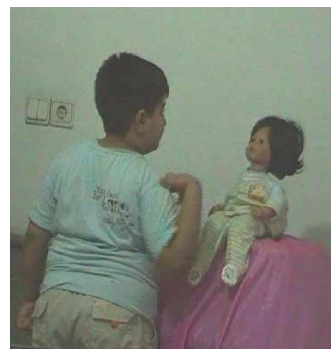
شکل ۲. تماس چشمی کودک الف با روبات

پایانی به عنوان جلسات پی‌گیری (Follow up) در نظر گرفته شد که پس از حدود ۲۵ روز رهاسازی هر کودک طی ۲ جلسه ۱۵ دقیقه‌ای با حضور کودک و آزمونگر مورد مشاهده قرار گرفتند (شکل ۳).