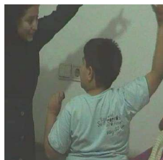
شکل ۳. تماس چشمی کودک الف با آزمونگر