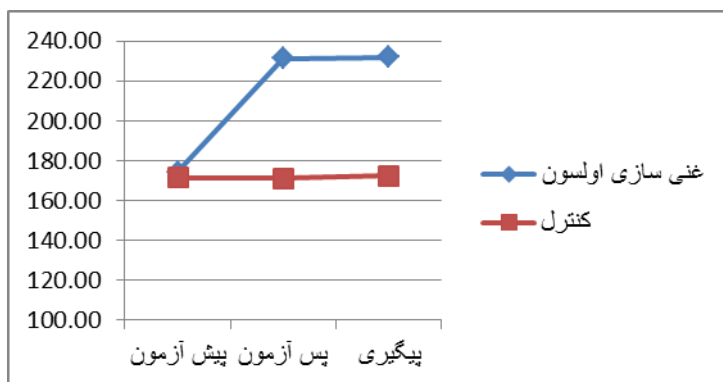
نمودار ۱. نمودار تغییرات صمیمیت زناشویی در طول زمان در زنان به تفکیک گروه

توجه به جدول میانگین‌ها، زنان و مردانی که مداخله غنی‌سازی روابط زناشویی به شیوه اولسون را دریافت کرده بودند، نسبت به زنان و مردانی که هیچ مداخله‌ای دریافت نکرده بودند، صمیمیت